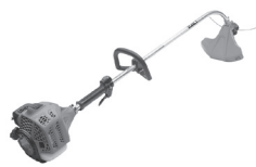
Coupe-gazon à arbre incurvé TBC-240PFCS