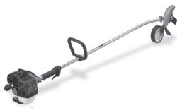
Coupe-bordure portable TPE-260PF