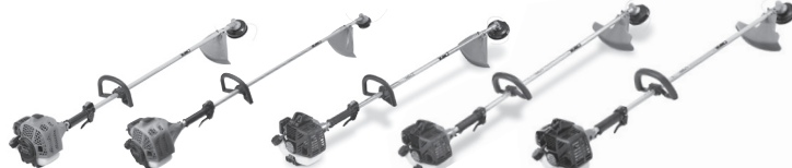
Coupe-gazons à arbre droit TBC-240PF / TBC-240PFS / TBC-255PF / TBC-260PF / TBC-280PF