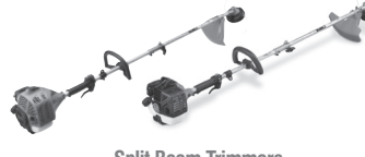
Split Boom Trimmers TBC-240SFS / TBC-260SF