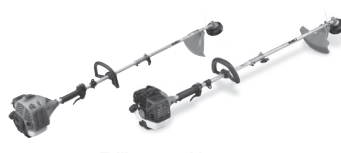
Tailleurs multi-usages TBC-240SFS / TBC-260SF