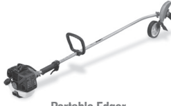
Portable Edger TPE-260PF